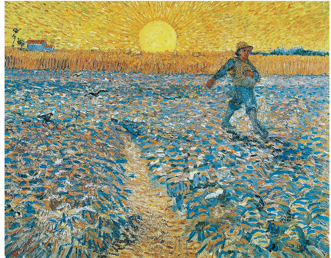
"Il seminatore al tramonto" - Vincent Van Gogh, 1888

MENDRISIO - AUDITORIO OBV / WEBINAR, MERCOLEDÌ 9 APRILE 2025